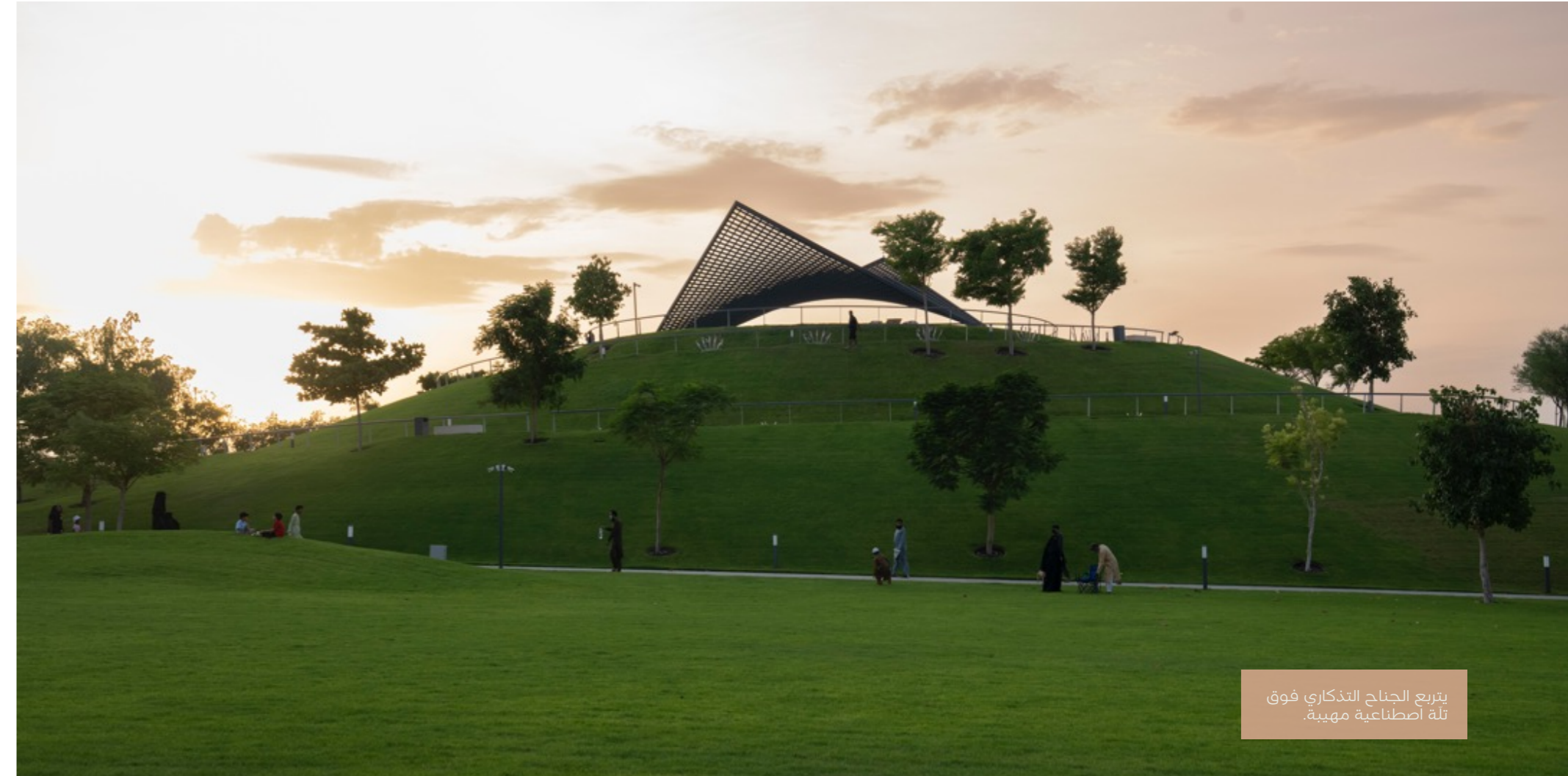
يتربع الجناح التذكاري فوق تلة اصطناعية مهيبّة.

ويتربع الجناح على تلة اصطناعية مهيبّة بارتفاع 15 متراً. وقد افتتحه سمو الشيخ سلطان بن أحمد القاسمي،