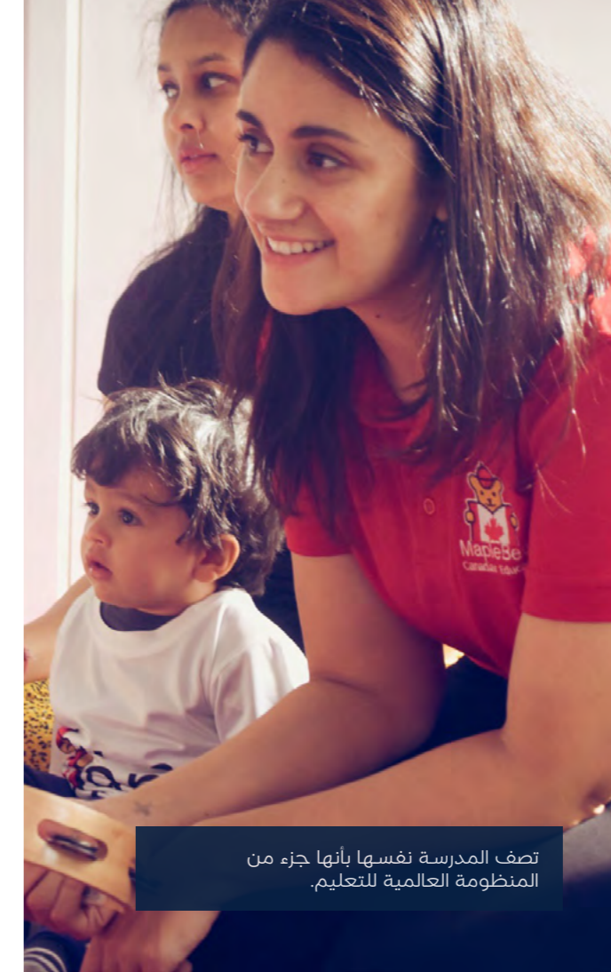
تصف المدرسة نفسها بأنها جزء من المنظومة العالمية للتعليم.

“إن تكامل الأفكار للمواد الدراسية يحفز الإبداع والتعبير عن الذات في كل مرحلة من مراحل البرنامج، ويشجع الأطفال على رؤية أنفسهم بصورة إيجابية ويعزز من قدراتهم التعليمية والشخصية”