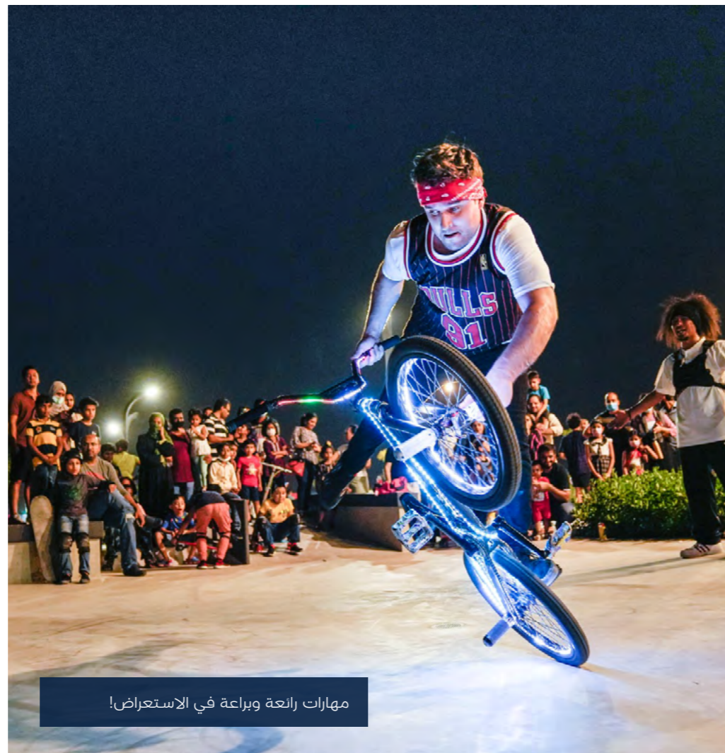
مهارات رائعة وبراعة في الاستعراض!