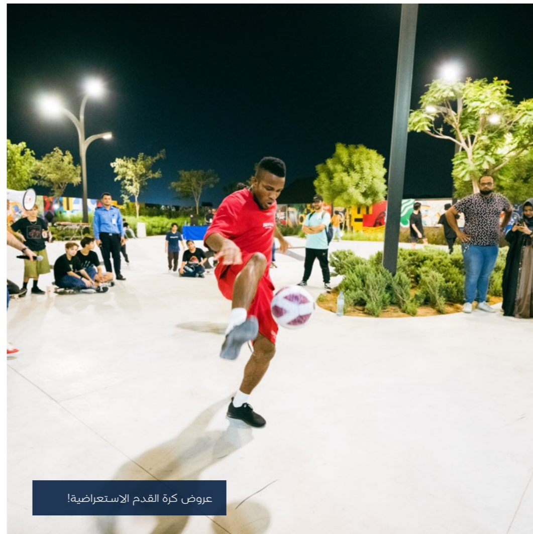
عروض كرة القدم الاستعراضية!