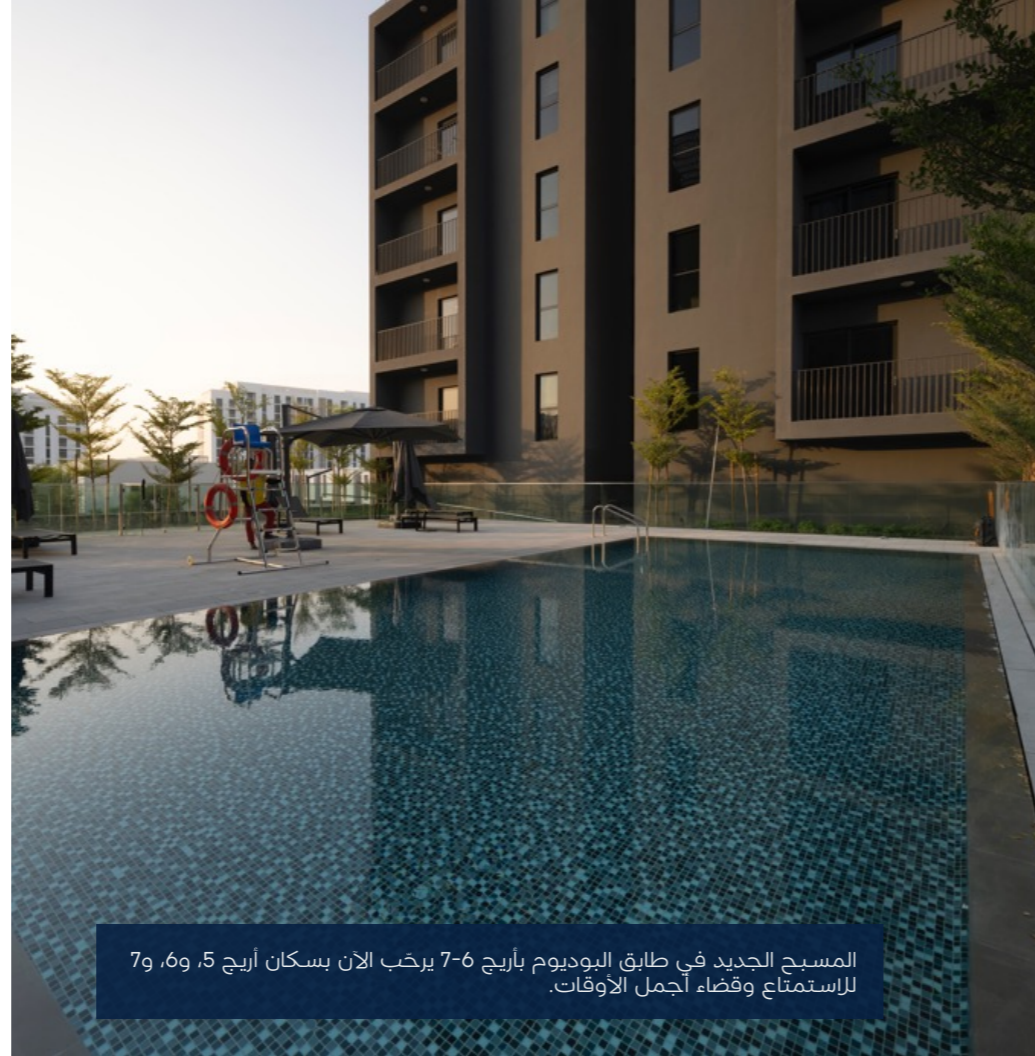
مسبح أريج 5-7

المسبح الجديد في طابق البوديوم بأريج 6-7 يرحب الآن بسكان أريج 5، 6، و7 للاستمتاع وقضاء أجمل الأوقات.