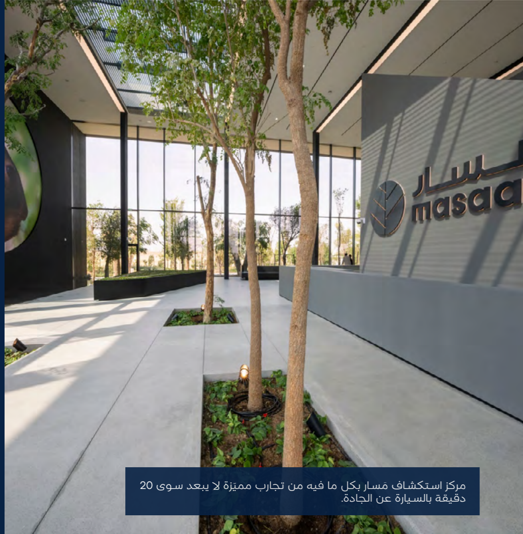
مركز استكشاف مسار

مركز استكشاف مسار بكل ما فيه من تجارب مميزة لا يبعد سوى 20 دقيقة بالسيارة عن الجادة.