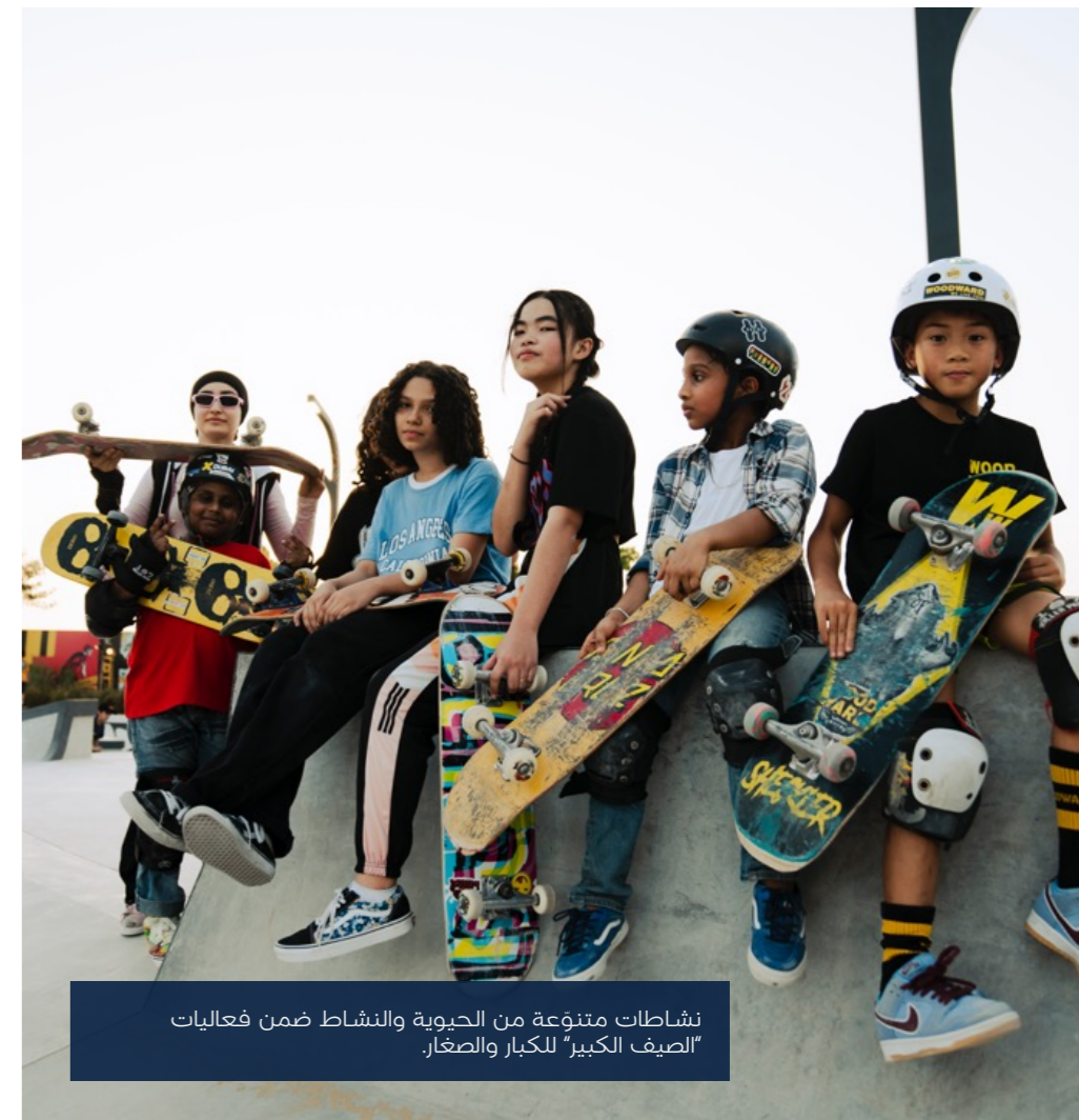
نشاطات متنوعة من الحيوية والنشاط ضمن فعاليات "الصيف الكبير" للكبار والصغار.