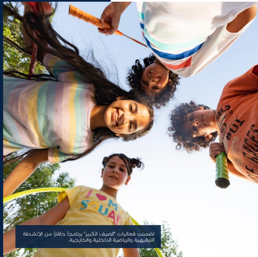
تضمنت فعاليات "الصيف الكبير" برنامجاً حافلاً من الأنشطة الترفيهية والرياضية الداخلية والخارجية.