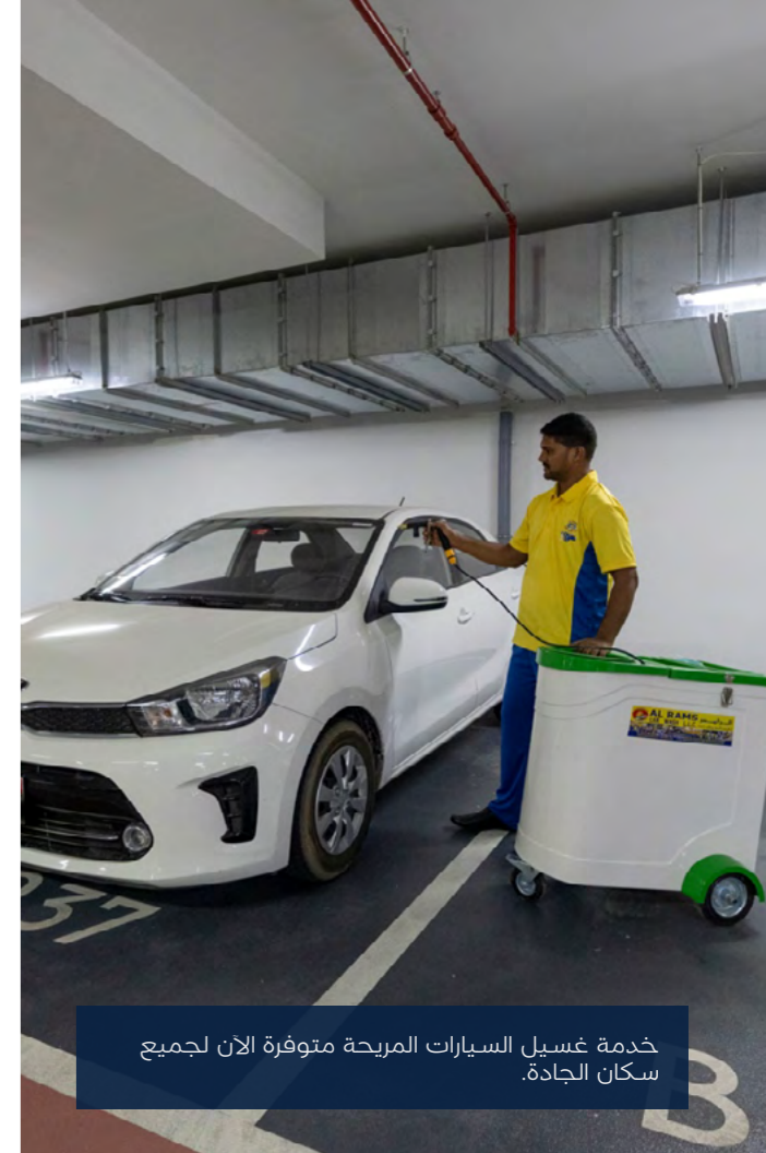
خدمة غسيل السيارات

خدمة غسيل السيارات المريحة متوفرة الآن لجميع سكان الجادة.